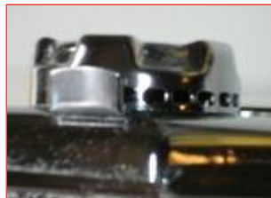
La ghiera di regolazione della distanza rulli

Quando la pasta ha assunto una forma regolare ed è liscia e consistente si riduce progressivamente l'apertura dei rulli agendo sull'apposita ghiera fino ad arrivare - per questo tipo di preparazione - al terz'ultimo foro: spessori di pasta più piccoli sarebbero molto più difficili da lavorare.