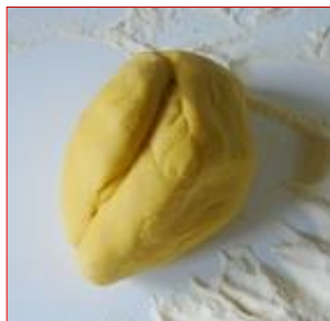
Infine diventa liscia e elastica

Attenzione ai cosiddetti "pasterelli", che sono frammenti di impasto che si staccano dall'impasto durante la lavorazione: all'inizio possono essere recuperati, ma poi da quando l'impasto assume la colorazione gialla questo non è più possibile, possibilmente toglierli stacciando la farina.