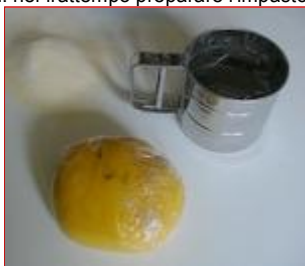
La pasta sta "riposando" e la farina in eccesso è stata stacciata

Avvolgere a questo punto la palla dell'impasto nella pellicola trasparente, oppure metterla fra due piatti, e lasciarla riposare per circa 30 minuti: nel frattempo preparare l'impasto.