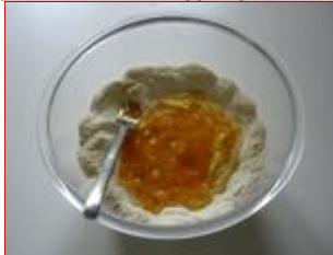
Si inizia a girare il tutto con la forchetta