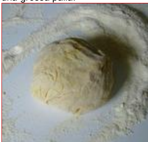
Dapprima l'impasto non è uniforme e farinoso

Quando la forchetta incontrerà molta resistenza, cominciare a lavorare l'impasto con le mani, sino a formare una grossa palla.