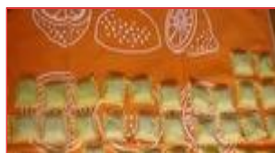
I ravioli su un telo sopra la spianatoia (opzionale)