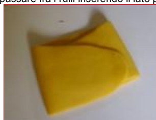
la pasta viene ripiegata in tre...