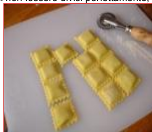
Ravioli pronti! Solo qualche ritocchino