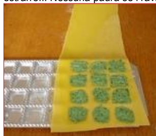
L'impasto per i ravioli è stato inserito

Infine, utilizzando il mattarello in dotazione, finire di spianare ulteriormente la pasta, ed infine capovolgere ed estrarre... Nessuna paura se i ravioli non fossero divisi perfettamente, la rotella tagliapasta sistemerà tutto.