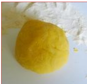
Continuando a lavorarlo assume un colore giallo