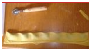
Tagliare: gli sfridi verranno reimpastati