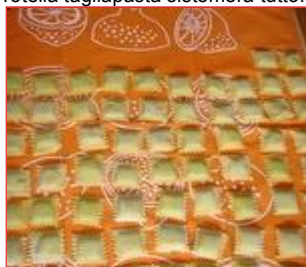
I ravioli su un telo sopra la spianatoia (opzionale)