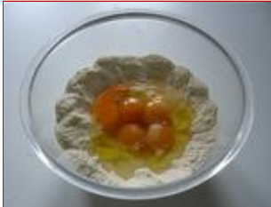
Le uova sono state appena sgusciate

Disporre la farina in una zuppiera, sgusciare le uova, aggiungere il sale e il cucchiaino di olio d'oliva: