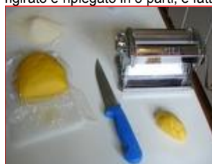
Si preleva una piccola quantità di pasta

L'utilizzo della macchina per la pasta a rulli è molto semplice: la pasta va prelevata a piccole quantità e fatta passare attraverso i rulli nella posizione di massima apertura: in questa prima fase ogni volta l'impasto va rigirato e ripiegato in 3 parti, e fatto passare fra i rulli inserendo il lato più largo.