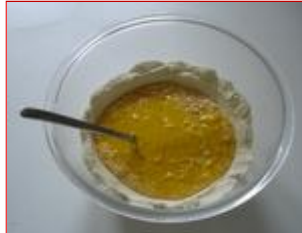
L'insieme comincia ad amalgamarsi

Sbattere le uova con la forchetta, lasciando sempre un velo di farina fra le uova e il recipiente, e continuare a girare in modo che le uova incorporino la farina.