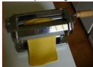
La forma dell'impasto diventa rettangolare

Lo scopo di questa lavorazione è quello di ottenere una forma rettangolare il più regolare possibile, in modo da utilizzare in pieno la larghezza dei rulli della macchina.