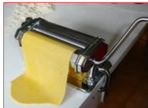
Fatto! Adesso si può iniziare