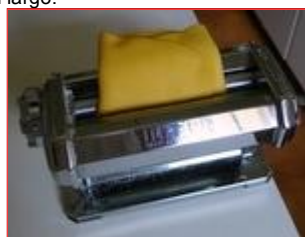
La pasta va fatta passare alcune volte

Lo scopo di questa lavorazione è quello di ottenere una forma rettangolare il più regolare possibile, in modo da utilizzare in pieno la larghezza dei rulli della macchina.