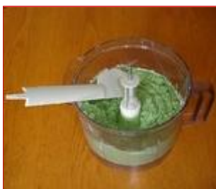
L'impasto per i ravioli

Ricetta per 4 persone Preparazione: 3.30 ore